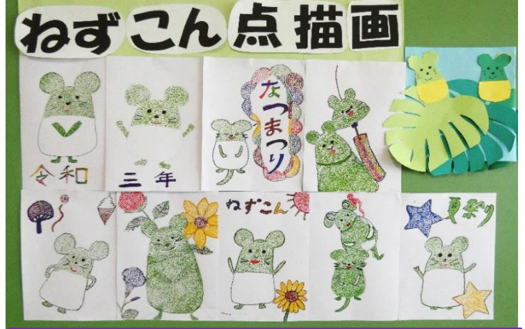
協会会長賞・美里園「点々で根気よく！」

利用者の皆さんが何日もかけて、点を1個ずつ置いていき、根気よく「テンビョウガ」を描きました。太めのマシックを使用して町のゆるキャラ「ねずこん」を描くことに挑戦しました。すごい集中力で職人のように点々を打って作品を仕上げました。