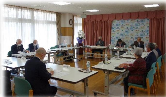
坂城福祉会 理事会・評議員会の様子